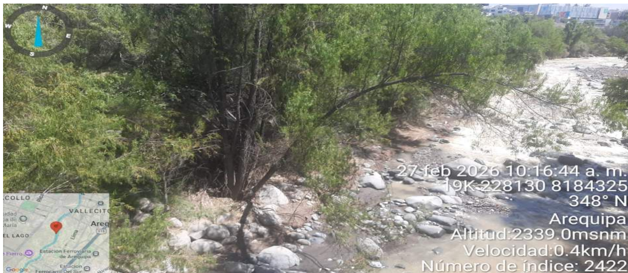
FIGURA N°01: SE MUESTRA AGUAS ABAJO DE LA MARGEN IZQUIERDA DEL RIO CHILI QUE SE ENCUENTRA EN RIESGO

27 feb 2026 10:16:44 a. m. 19K-228130 8184325 348° N Arequipa Altitud: 2339.0msnm Velocidad: 0.4km/h Número de índice: 2422